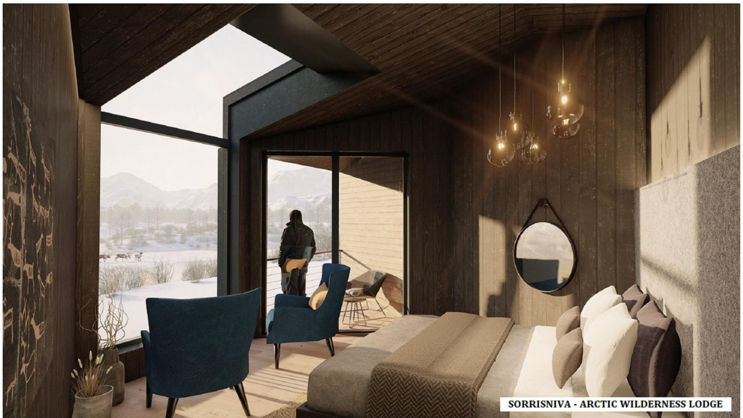
SORRISNIVA - ARCTIC WILDERNESS LODGE